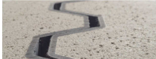
Instalação de Junta Signature AR finalizada que permite o movimento direcional do tráfico