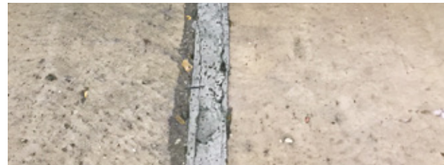
Junta danificada que apresenta uma deterioração pelo impacto